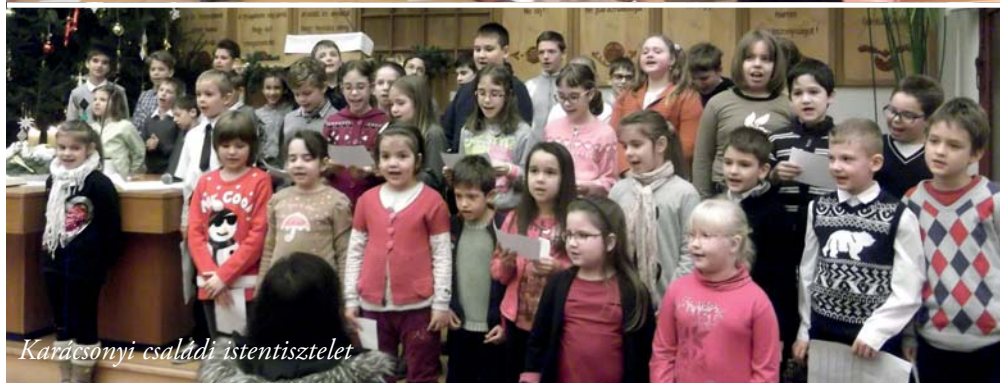
Karácsonyi családi istentisztelet