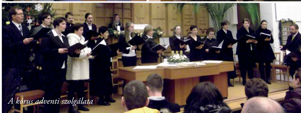
A kórus adventi szolgálata