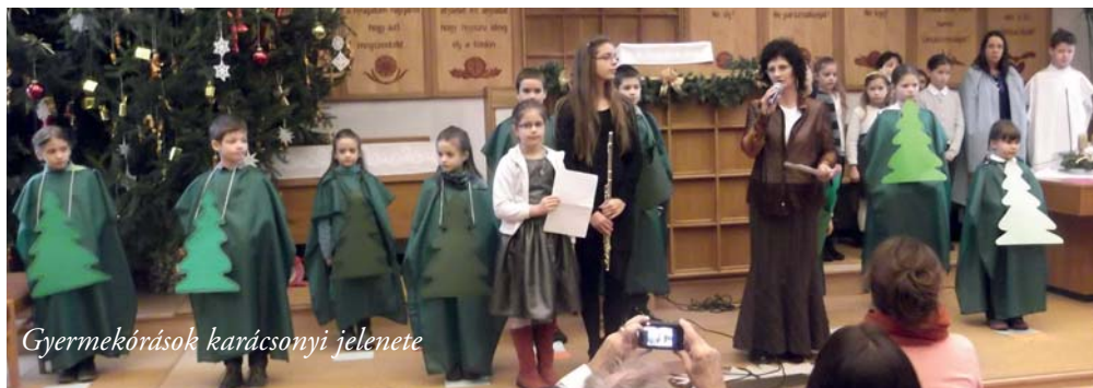
Gyermekóráskok karácsonyi jelenete