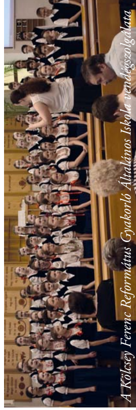
A Kölcsey Ferenc Református Gyakorló Általános Iskola vendégszolgálatá