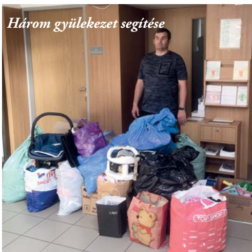
Három gyülekezet segítése

„Szivárványívemet helyezem a felhőkre, az lesz a jele a szövetségnek, melyet én a világgal kötök.” 1Móz 9,13