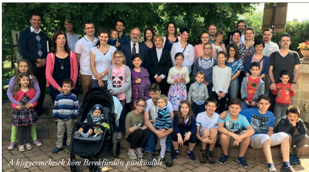
A kisgyermekesek köre Berekfürdön pünkösdőlt

Kórházlelkészek: Kenézy Kórház – 511-777/1943; Klinika – 319-057 Európa Rádió – 94,4 MHz