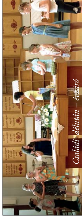
Családi délután – éntzáró