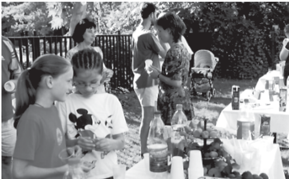
Augusztusi templomkerti találkozó