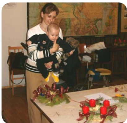
A Kismamakör adventi koszorút készít