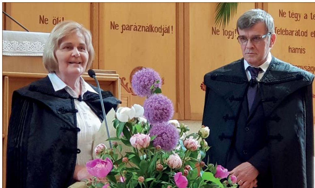
30 éve a Nagyerdei Gyülekezetben