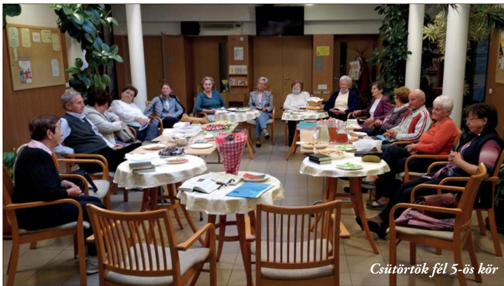
Csütörtök fél 5-ös kör