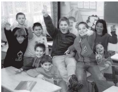
Hittanosok a Kardos utcán