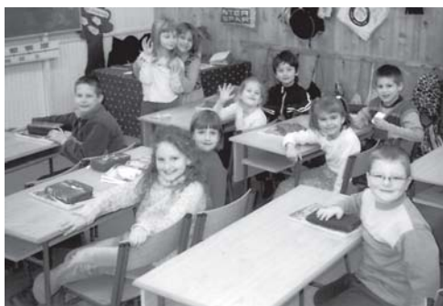
Kardos utcai hittanosok