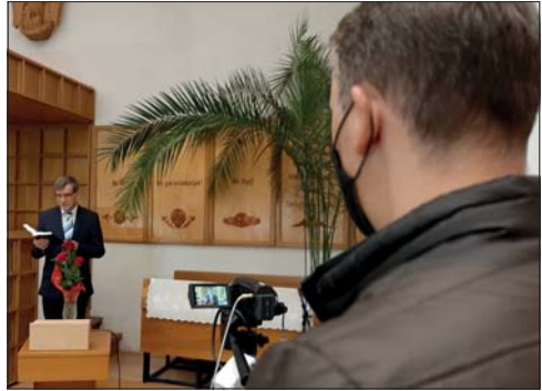
Online istentisztelet felvételei