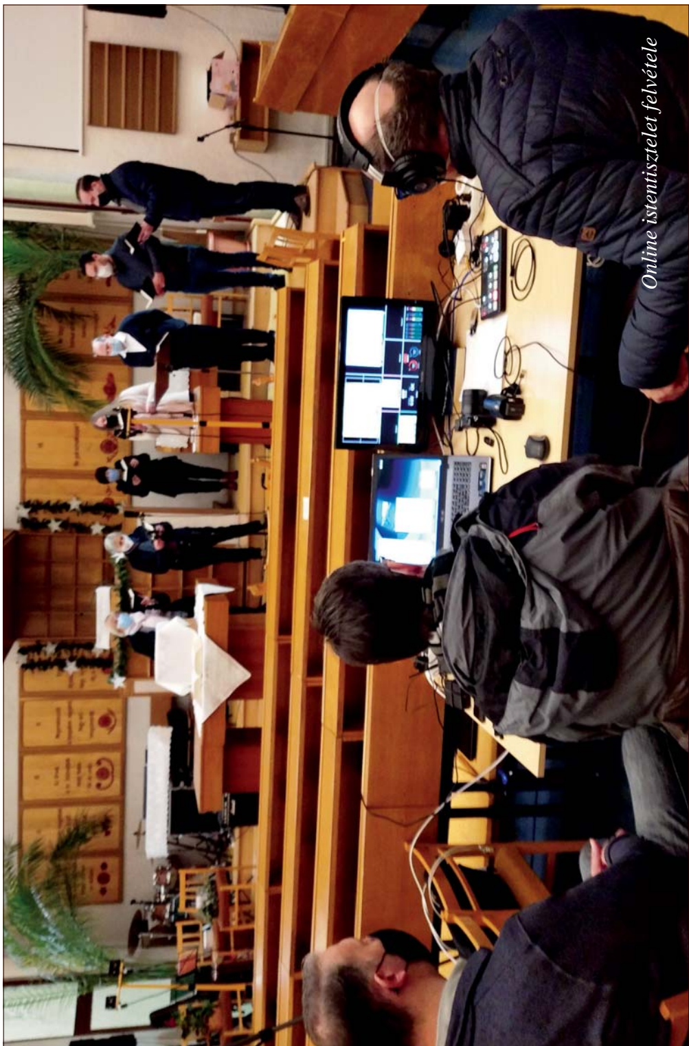
Online istentisztelet felvétele