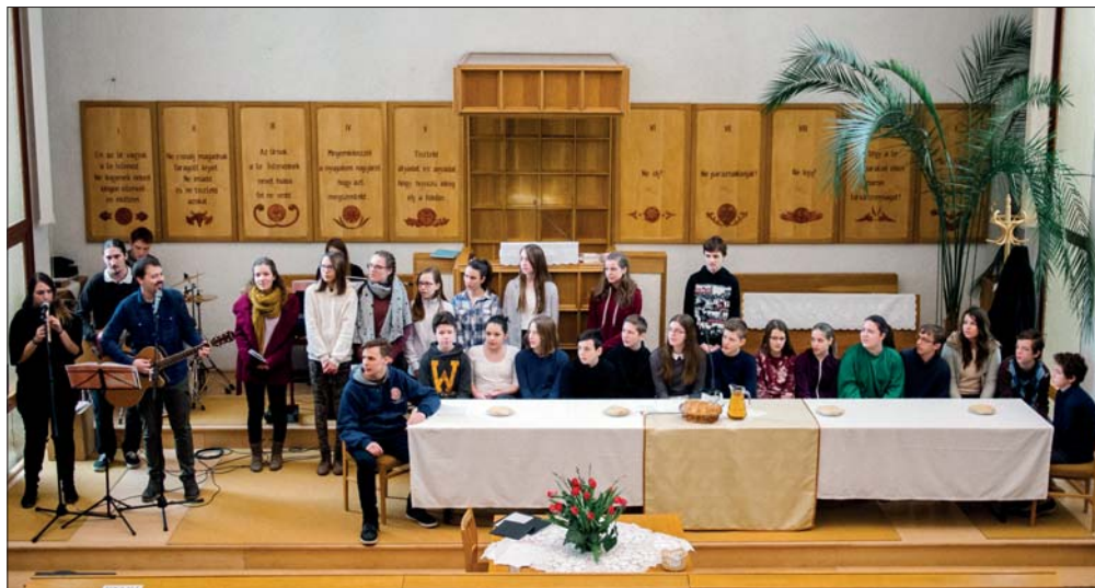
A konfirmációra készülő fiatalok szolgáltak a március 11-i istentiszteleten

Imádkozom lélekkel, de imádkozom értelemmel is, dicséretet éneklek lélekkel, de dicséretet éneklek értelemmel is. (IKor 14,15)