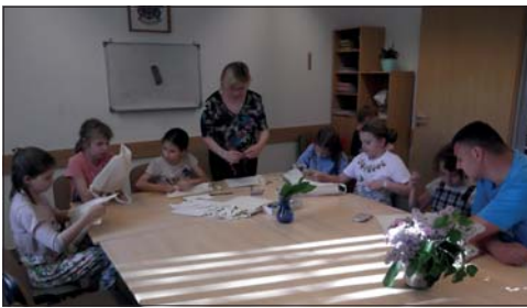
A családi délutánon a gyermekek anyák napjára készülhettek a kézműves foglalkozáson.