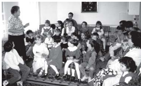
Vasárnapi gyermekórát tart

„Szolgáljatok az Úrnak örömmel... Tudjátok meg, hogy az Úr az Isten! Ő alkotott minket, az övéi vagyunk: az ő népe és legelőjének nyája. Menjétek be kapuin hálaénekekkel... Mert jó az Úr, örökké tart szeretete, és hűsége nemzedékről nemzedékre.” (Zsolt 100, 2-5)