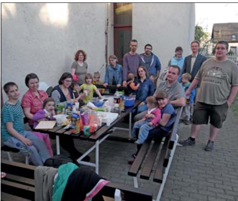
20 évvel ezelőtti Középfői találkozója