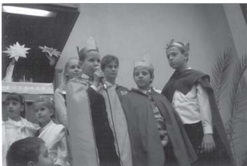
Karácsonyi műsor Családi istentiszteleten