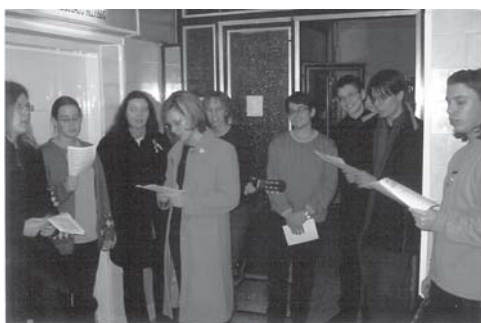
Ifjeseink kórházban kántáltak