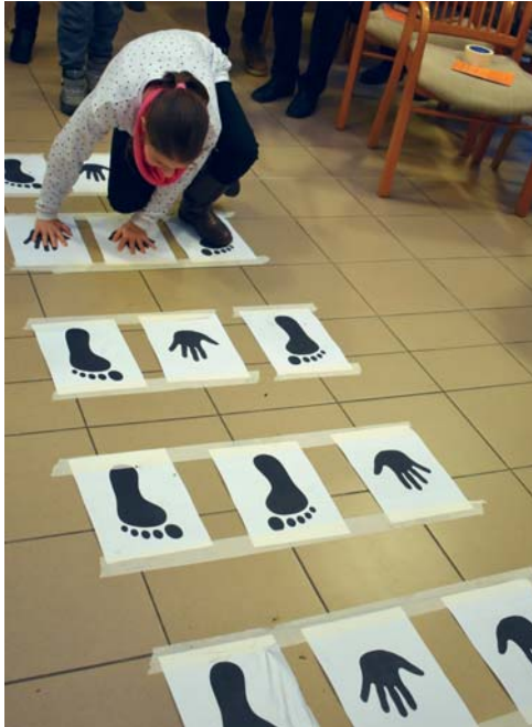
Játék a családi délutánon