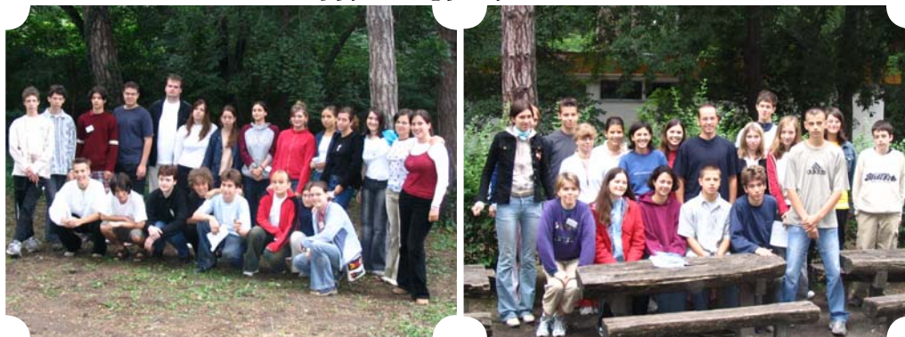
Az újfői és a legújabbfői a táborban