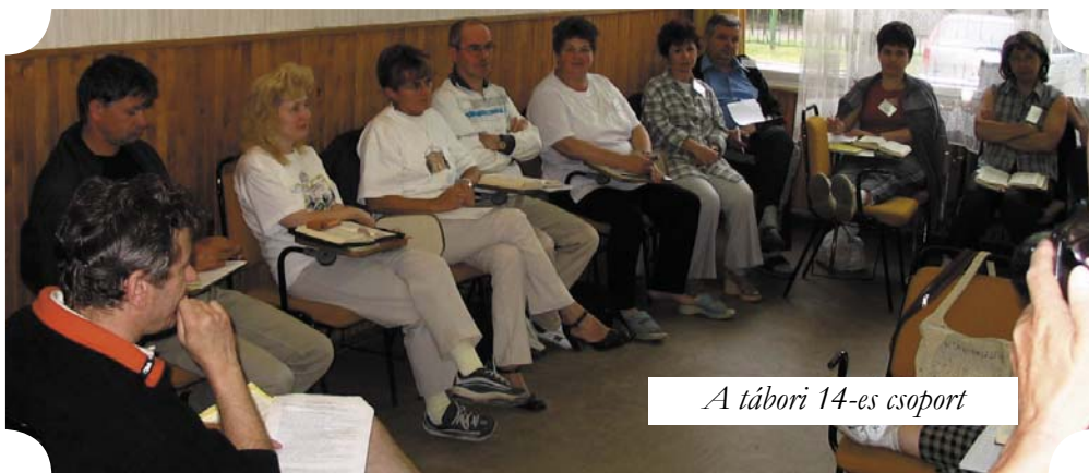
A tábori 14-es csoport