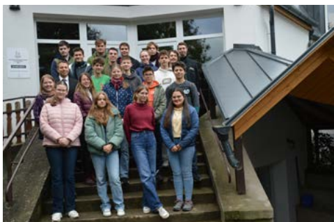
Ifjs hétféve Tiszanagyfaluban