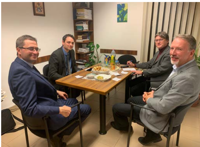
A presbitérium négy fős elnökségi tanácsot választott