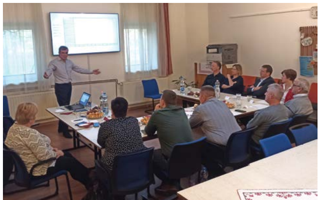
Székykeresztúri küldöttség hallgatta a gyülekezetépítési látásunkat