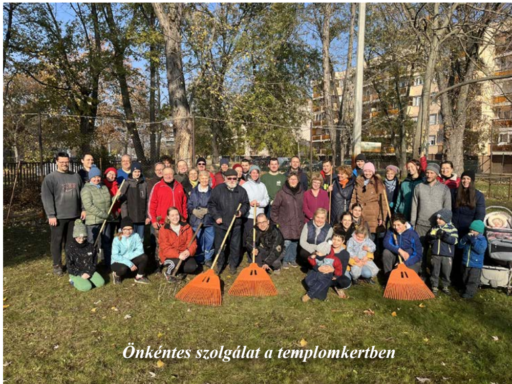
Önkéntes szolgálat a templomkertben

Debrecen-Nagyterdei Református Egyházközség