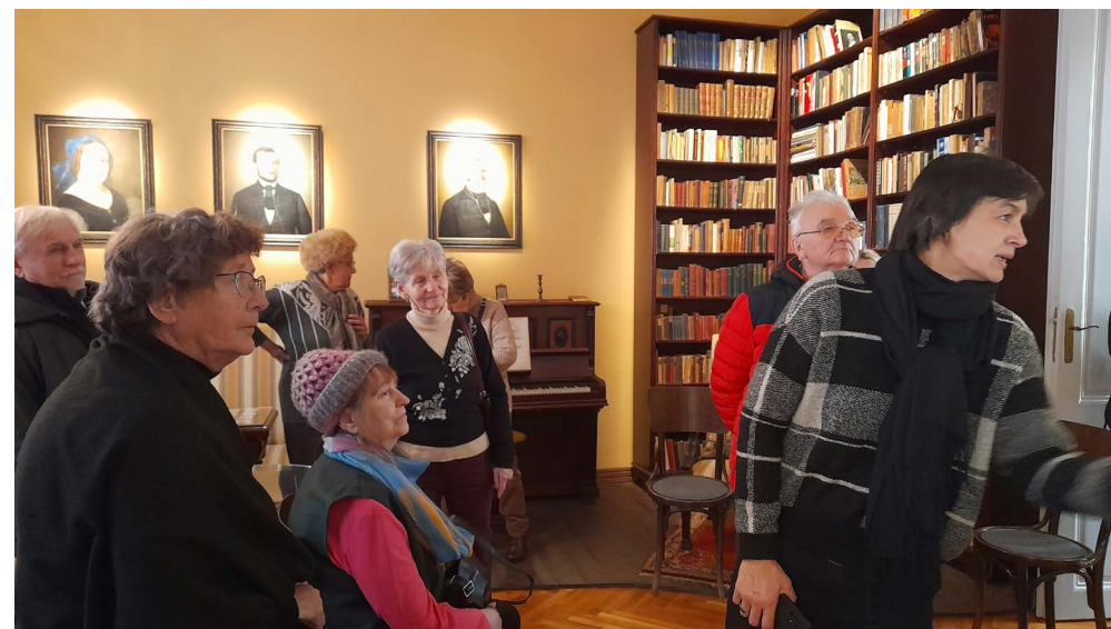
Gyülekezetünk egy csoportja Szabó Magda kiállításon