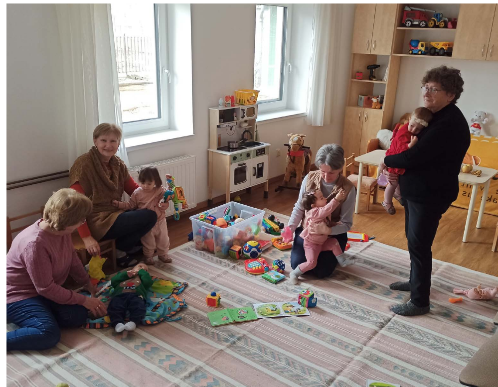
Gyermekek közötti szolgálat kismamakörön