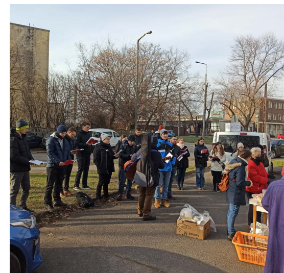
Ételosztás a hajléktalanétkeztetésen

A „Nagyerdei Egyházközségért” alapítvány adószáma: 18545269-1-09.